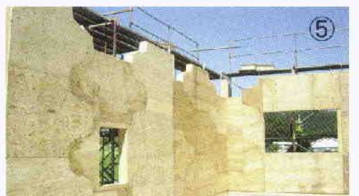
ここまでの組立て時間30分